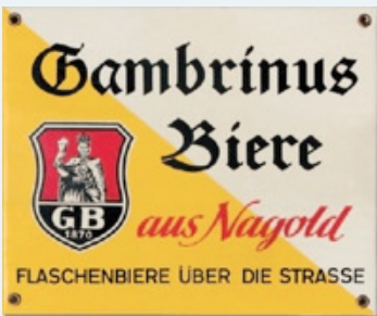
Erster Kunde Gambrinus, Nagold